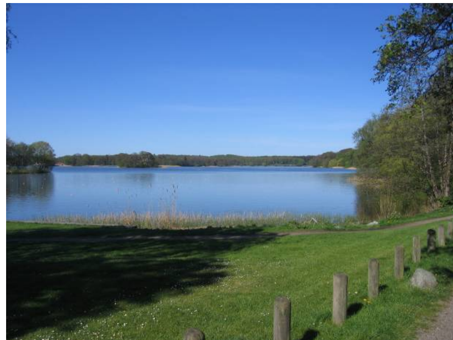
Bagsværd Sø set fra Nybrovej.

DN har rejst denne fredning for at sikre at området for os alle. Vi siger, at man freder for 100 år i modsætning til lokalplaner, som kan ændres på 8 uger.